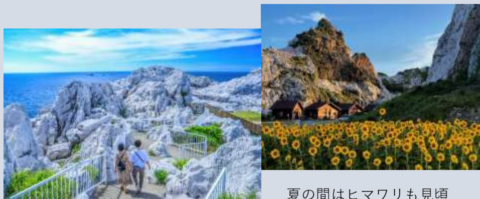
夏の間はヒマワリも見頃