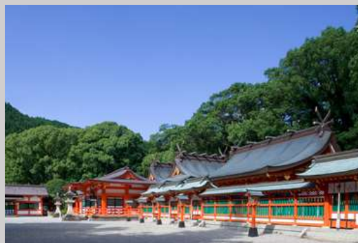
熊野速玉大社（世界遺産） 熊野本宮大社、熊野那智大社とともに熊野三山を構成する大社