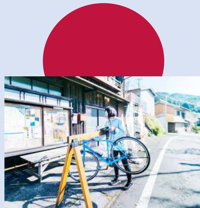
信号のない町「古座川町」をサイクリング！