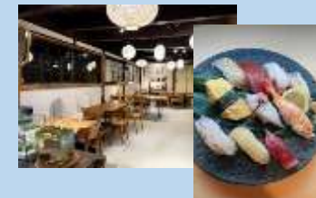
「うみまち食堂うらら」