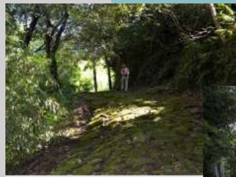
高野坂（世界遺産） 熊野速玉大社から熊野那智大社へ巡拝する際に通った中辺路ルート