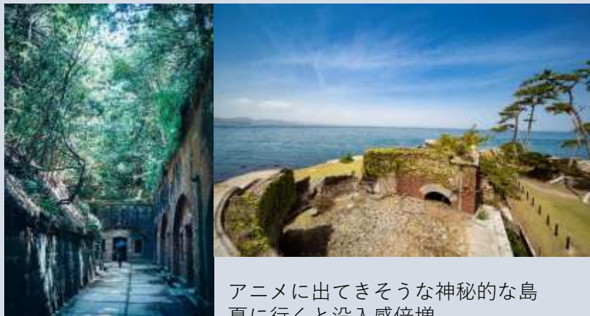
アニメに出てきそうな神秘的な島 夏に行くと没入感倍増