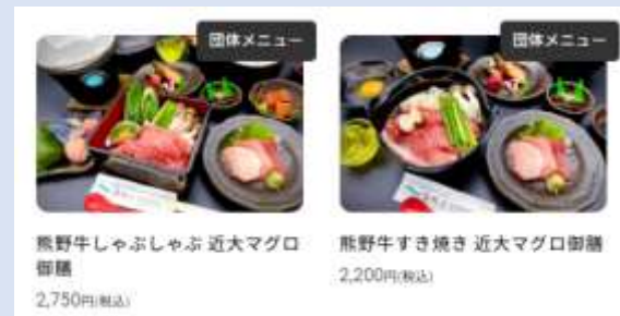
熊野牛しゃぶしゃぶ 近大マグロ御膳 2,750円(税込)

2階に団体用座敷あり。新宮市宿泊時の夕食利用に。 ※夜営業のみ ※アラカルトのみ