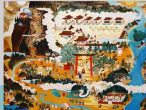
熊野新宮参詣曼荼羅図