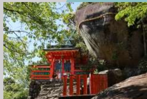
神倉神社（世界遺産） 熊野古道の一部である五百数十段の急峻な石段を登ったところにご神体の「ゴトビキ岩」があります。