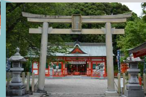
阿須賀神社（世界遺産） 熊野川河口付近に鎮座する神社