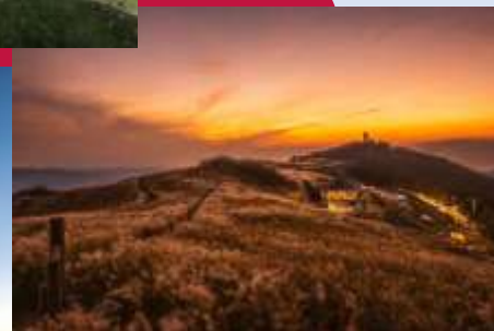
秋のススキは絶景！