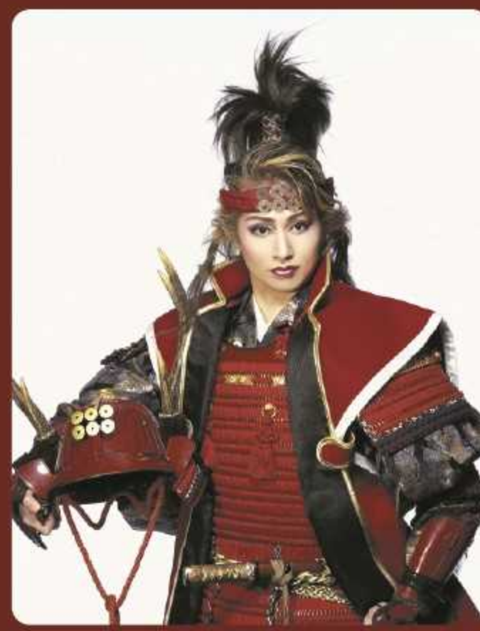
九度山町観光大使 元OSK日本歌劇団トッパスター 桜花昇ぼる