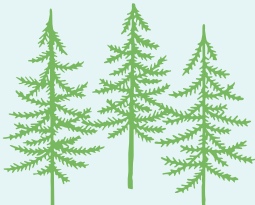
写真は全てイメージです。

(2)当社は、前号により取得した個人情報について、お客様との連絡のために利用させていただくほか、お客様がお申込みいただいた旅行において旅行サービスの手配及びそれらのサービスの受領のための手続に必要な範囲内で利用し、また、お申込みいただいたパンフレット等に記載された運送・宿泊機関等及び保険会社、手配代行者に対し、電子的方法等で送付することにより提供いたします。その他、当社は、①当社の商品やサービス、キャンペーンのご案内②旅行参加後のご意見やご感想の提供のお願い③アンケートのお願い④特典サービスの提供⑤統計資料の作成に、お客様の個人情報を利用していただくことがあります。